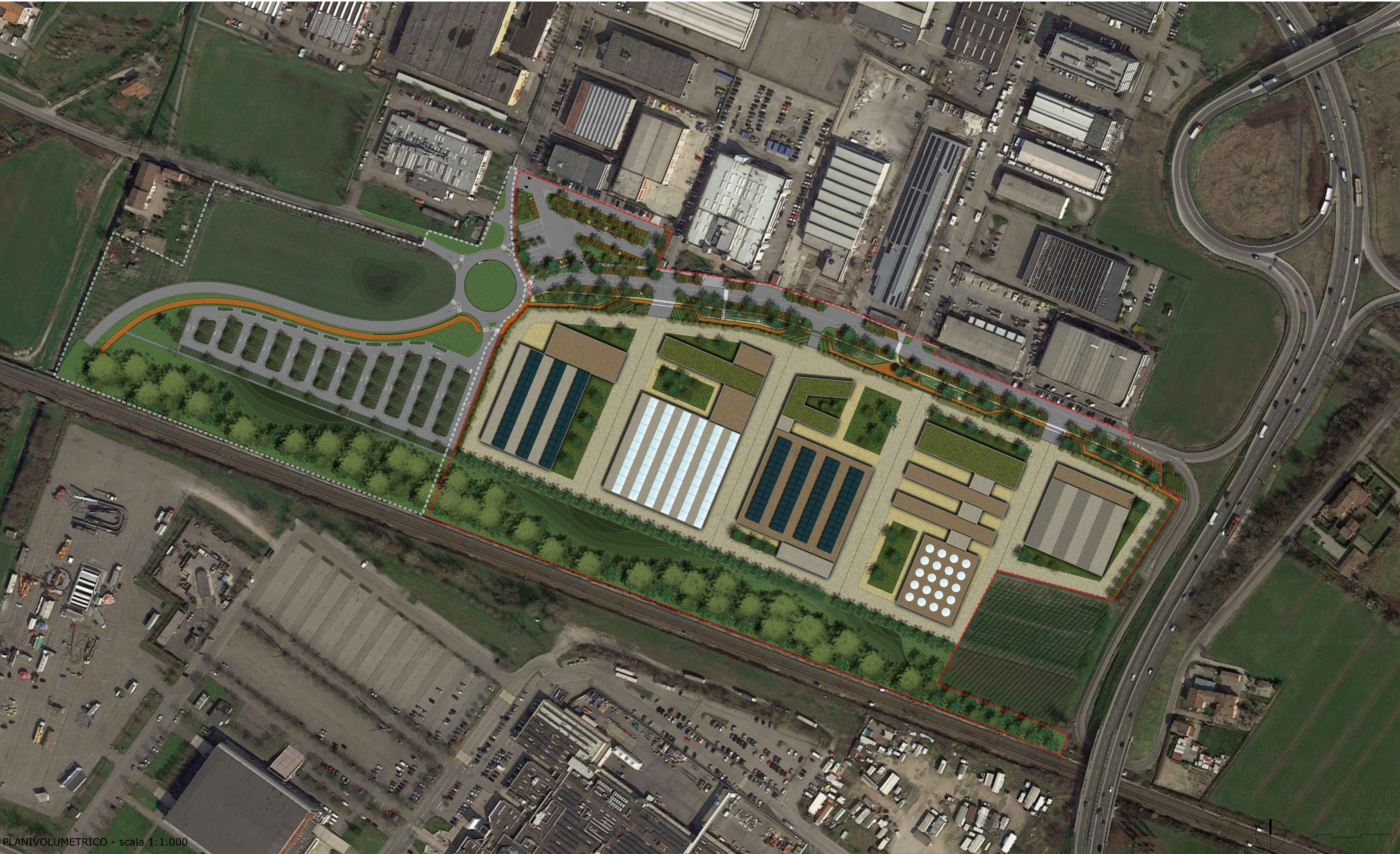
PLANIVOLUMETRICO - scala 1:1.000